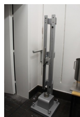
Fallhammer (EC A.14.)