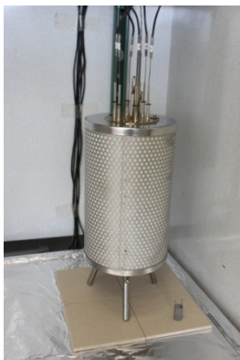
Greuer-Ofen (EC A.16.)

Im Laufe der Zeit werden noch andere Prüfungen in unser GLP-Portfolio aufgenommen. Einige Geräte befinden sich momentan bereits im Aufbau. Welche Prüfungen die nächsten sein werden, können Sie gerne mit beeinflussen, indem Sie uns über Ihre Wünsche und Bedürfnisse informieren und mit uns über Lösungsmöglichkeiten diskutieren. Dass wir schnell, zuverlässig, flexibel und kundenorientiert arbeiten können, haben wir durch den schnellen Aufbau unserer Prüflabors gezeigt. Diese Eigenschaften wollen wir auch in der Zukunft beibehalten und so den Weg für eine langfristige und erfolgreiche Partnerschaft mit unseren Kunden ebnen.